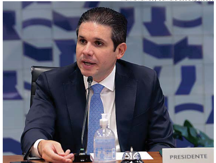
Hugo Motta, presidente da Câmara dos Deputados, defende ampliar mais 14 vagas chegando a 527 cadeiras